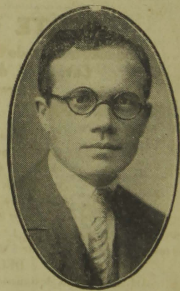
Dr. José Americo de Almeida

O illustre homem publico fôra á metropole do paiz contestar os diplomas dos candidatos perrepistas,